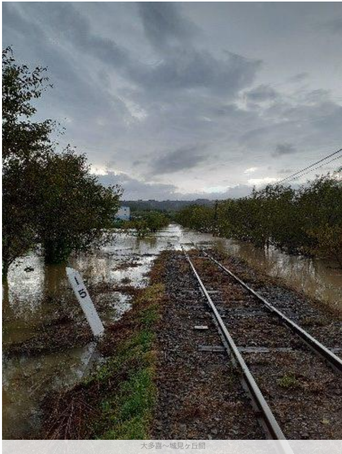
大多喜～城見ヶ丘間