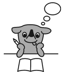
千葉県マスコットキャラクター チーバくん