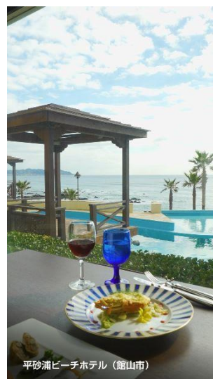
平砂浦ビーチホテル (館山市)