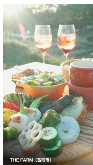
THE FARM (香取市)