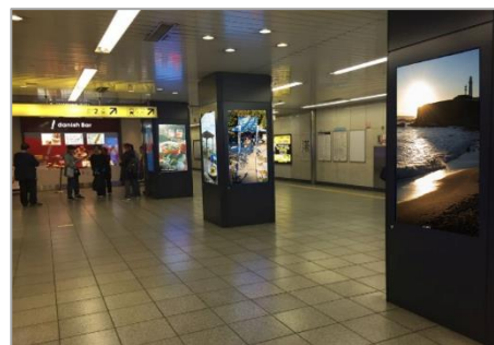
掲出イメージ(デジタルサイネージ)