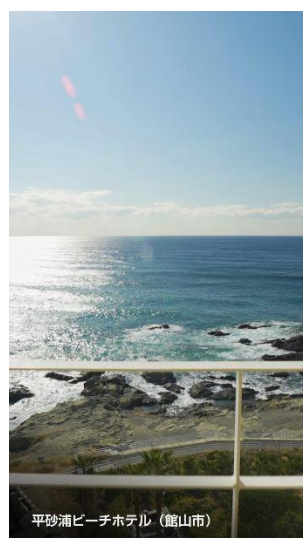
平砂浦ビーチホテル (館山市)