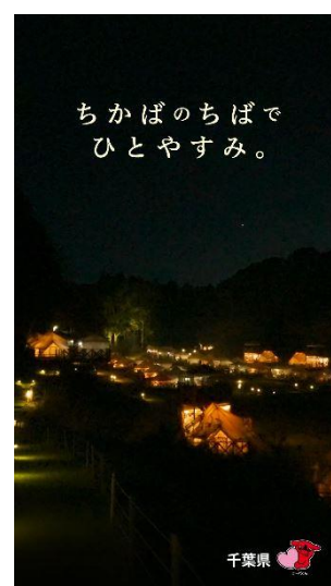
THE FARM (香取市)