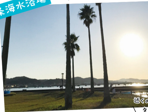
近くの鏡ヶ浦からの夕陽もキレイ!

ヤシの木が連なるリゾート気分満点の海水浴場。海岸沿いにはおしゃれなカフェやレストランなども充実しています。