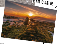
白浜の屏風岩の 夕陽も絶景

📅 7月17日(金)～8月16日(日) 📍 南房総市白浜町根本 📞 南房総市観光プロモーション課 ☎ 0470-33-1091