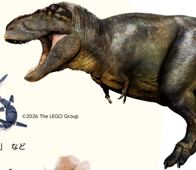
陸のハンター ティラノサウルス