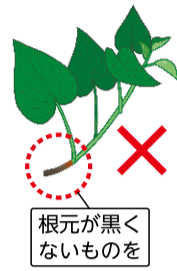
根元が黒くないものを