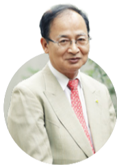
北川フラムさん