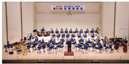
習志野高校吹奏楽部