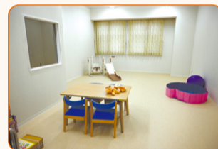
こどもが安心して過ごせる カウンセリングルーム