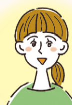
心理学的な視点から、面接や 検査などを行いサポートする 児童心理司