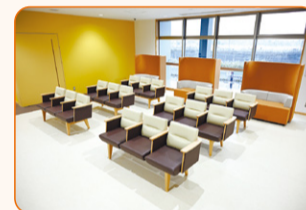
落ち着いた色調の 待合スペース