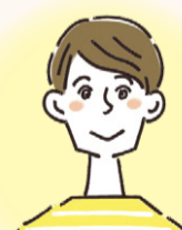
一時保護所や児童養護施設、児童自立支援施設で 学習指導や生活支援を行う 保育士