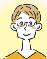
児童自立支援施設で生活指導や 自立に向けた支援を行う 児童自立支援専門員