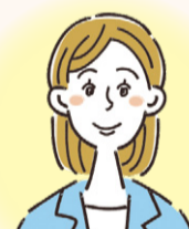
児童相談所で相談を受け、 支援につなげる 児童福祉司

県の児童相談所などには、こどもの福祉に特化して経験を積んだ児童福祉専門の職員を多く配置しています。さまざまな相談に対応できるよう、人材確保に取り組むとともに、職員のスキルアップのための研修や資格取得の支援なども積極的に行っています。