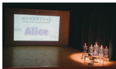
課題研究発表会の様子

2011(平成23)年に情報コミュニケーション科を設置した袖ヶ浦高校では、AIの活用やアプリ開発など、実践的なデジタル技術を磨き、学びに生かす多彩な授業が行われています。授業では、身近な困りごとをデジタルの力で解決する学びが充実。そのアイデアや成果を発表する機会も多く、課題解決能力や自己表現力も日々磨いています。