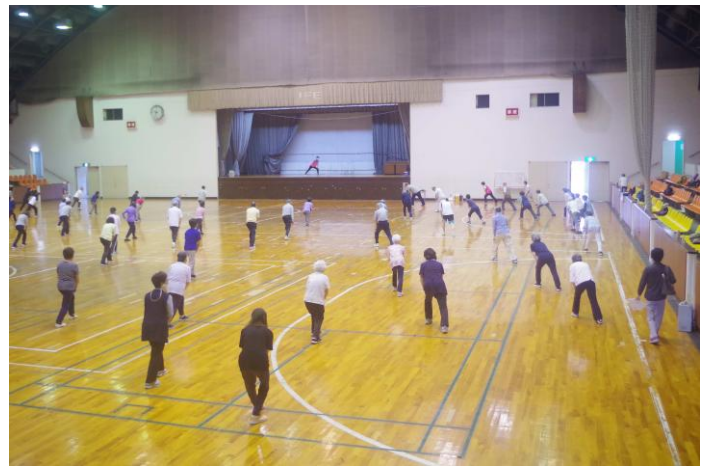
健康運動講座 ロコモ予防運動