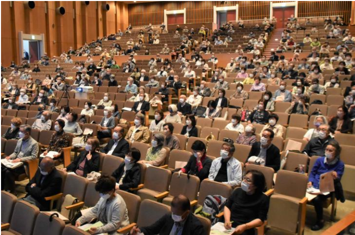
教養文化講座 会場全景と講座受講者