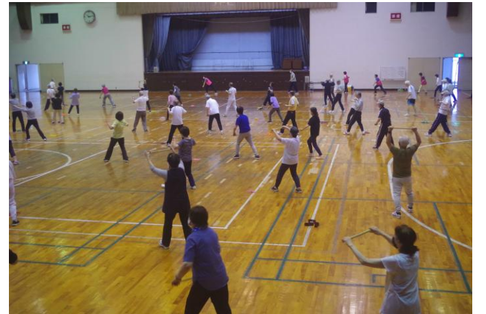
健康運動講座 バンブーエクササイズ