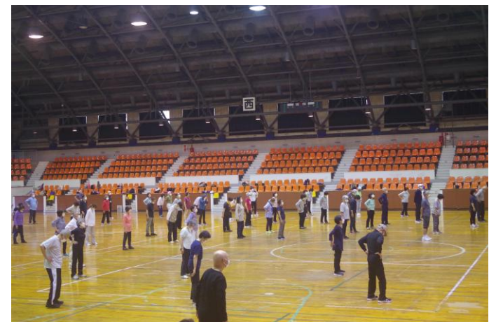
健康運動講座 筋肉ほぐし&クールダウン