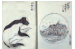
銚子の海驢島とアシカ

江戸時代、赤松宗旦が利根川流域の自然や歴史、文化をまとめた「利根川図志」と当時の