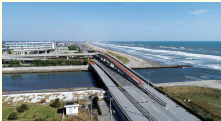
九十九里有料道路