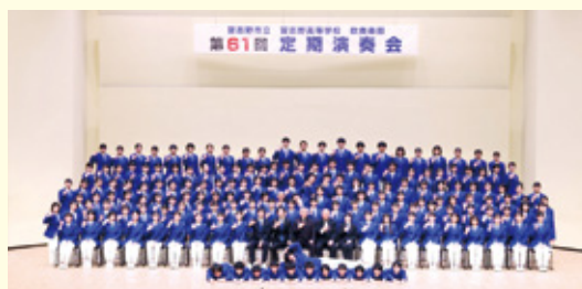
習志野高校吹奏楽部

和楽器集団切腹ピストルズ、鵜原の大名行列・みこし、アート体験・ワークショップ、プレイキン体験、キッチンカー、出張かつうら朝市 など