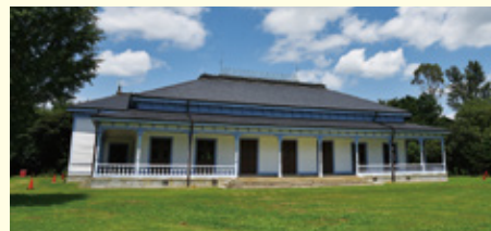
旧学習院初等科正堂