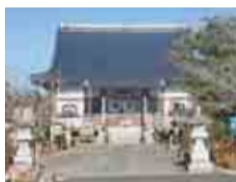
妙覚寺には忠敬の先祖(小関家)の墓碑があります

測量技術を支える数学の知識と、55歳から全国を回った情熱を持ち合わせた伊能忠敬のルーツを巡ってみては。