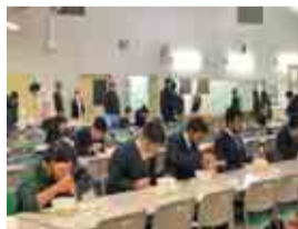
夕食を食べてリフレッシュ!

生徒たちは日々の充実した「学び」の中で、これからも夢に向かって力強くチャレンジしていきます。