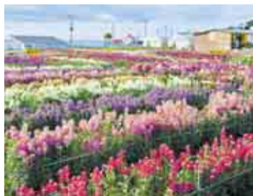
海に臨むお花畑は春らしい色でいっぱい!