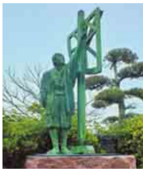
伊能忠敬と測量器の銅像

全国を歩いて測量し、初めて正確な日本地図を作った人物として有名な伊能忠敬は、1745年2月11日(旧暦1月11日)に九十九里町の小関家に誕生しました。忠敬の生誕250周年と町制施行40周年を記念して生家跡地に銅像が建てられ、記念公園として整備されました。