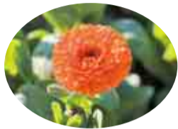
南房総市は全国有数のキンセンカの生産地

太平洋に面する南房総市千倉町にある白間津のお花畑では、潮風に乗って花の香りが広がります。温暖な地域のため、人工的な設備をほとんど使用しない露地栽培が盛んです。