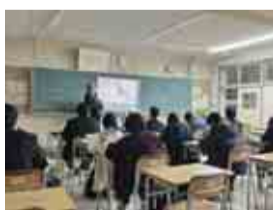
落ちついた環境での学び

生浜高校の定時制は午前部・午後部・夜間部の三部制です。三部制では、例えば夜間部の生徒が午後部の授業を取るなど、他部履修をすること