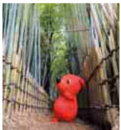
すがすがしい空気に満ちている坂道

竹林に囲まれた坂道は江戸時代に武士が多く通ったといわれていることから「サムライの古径」とも呼ばれています。