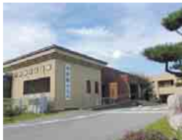
約200点の作品が展示されています

菱川師宣記念館では、代表作である「見返り美人図」(複製)だけでなく、江戸時代の美術界に影響を与えた「歌舞伎のガイドブック」や「タウン誌」などに当たるさまざまな版本を展示しています。その他、師宣の生い立ちや活躍の全貌を、作品や映像シアター(随時上映)で紹介しています。