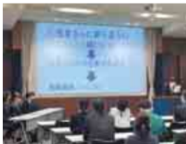
実習の成果を発表します

どの時代・場所にも、必要とされる「医療」と「福祉」。長狭高校では、今後も地域と連携しながら、人を救う人材を育てていきます。