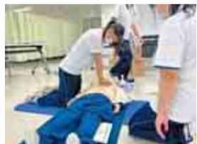
大学と連携して一次救命処置を学びます

長狭高校では2年生から文系、理系コースのほか、医療・福祉分野での活躍を目指す「医療・福祉コース」を選択できます。