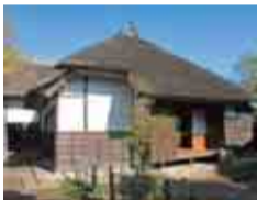
当時の暮らしを感じる武家屋敷

坂を上った先には佐倉藩士が暮らした3つの武家屋敷が並び、城下町の面影をしのぶことができます。旧但馬家住宅、旧武居家住宅は常時内部見学が可能。昔へタイムスリップしたような気分を味わってみませんか。