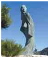
見返り美人図像がお出迎え

開館時間 9時～17時(16時30分最終入館) / 休館日:月曜日(祝日の場合は翌火曜日)