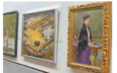
昨年の県展の様子

県内最大の美術公募展である「千葉県美術展覧会(県展)」を開催します。日本画、洋画、彫刻、工芸、書道の5部門の入選作品を県立美術館で展示。会期中には、アーティスト・トークや作品解説会も行います。