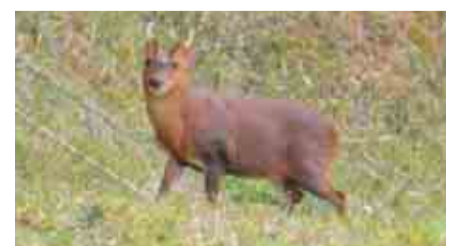
特定外来生物のキョン