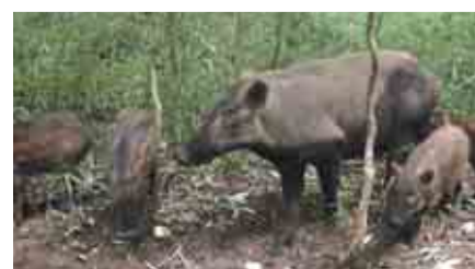
農作物を食い荒らすイノシシ