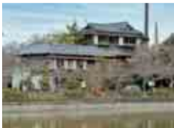
八鶴亭はレストランや貸しスペースとなっています

湖畔には、大正から昭和初期に建てられた、国登録有形文化財の八鶴亭(旧八鶴館)があります。旅館として栄えた当時の姿を想像しながら、歴史散策も楽しめます。