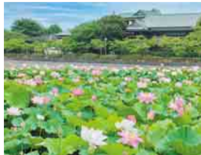
ハスの花はお昼に閉じるため、朝早くの訪問がおすすめ