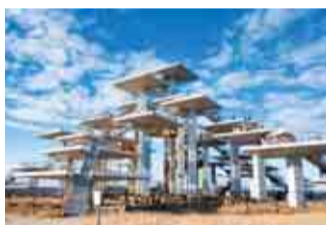
空と海のパノラマビューを楽しめます

場所 富津市富津2280 交通 JR内房線青堀駅から富津公園行きバス終点下車徒歩20分 館山自動車道「木更津南IC」から車で20分(無料駐車場100台) 入場料 無料(富津公園内の一部施設は有料) 問い合わせ 富津公園管理事務所 TEL0439-87-8887