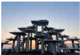
夕方は絶好のシャッターチャンス