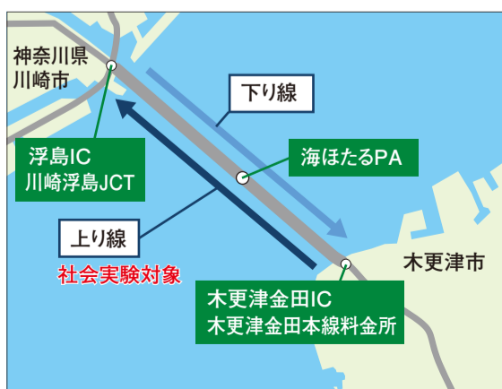
東京湾アクアライン