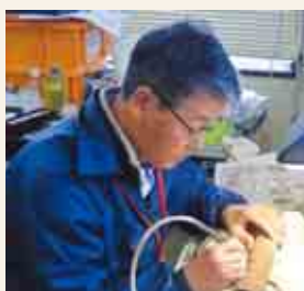
化石のクリーニングを見学できるブースも登場する。作業日はホームページを確認を。