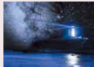
銚子の星空と犬吠埼灯台