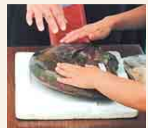
なんと本物の化石に触れるコーナーもあります！(写真はイメージ)