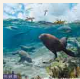
当時の様子を鮮やかに再現した復元画。化石と並ぶ実物大のイラストも迫力満点！