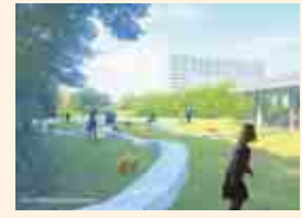
芝生広場にはアート遊具で遊ぶ癒しの空間も