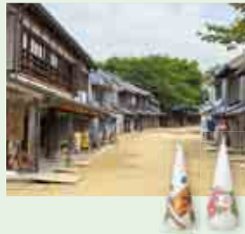
8/5-6 むらの緑日夕涼み。金魚すくいや大人向け怪談なども