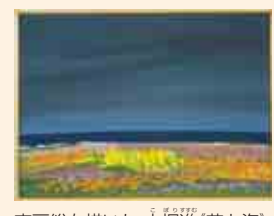
南房総を描いた 小堀蓮(花と海)