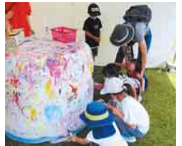
ロールペールラップサイロに落書き