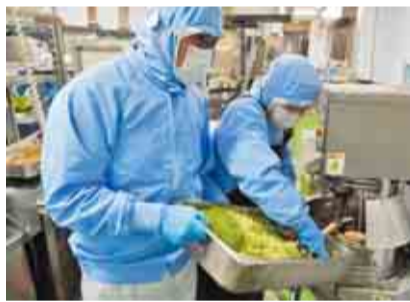
(有)青倉商店(食品加工・南房総市)