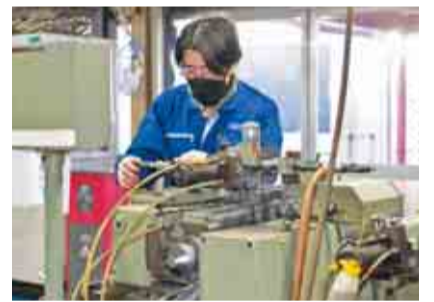
(株)武井製作所(金属加工・松戸市)