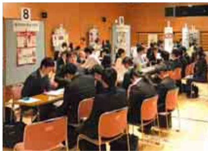
ジョブカフェちばでの合同企業説明会の様子