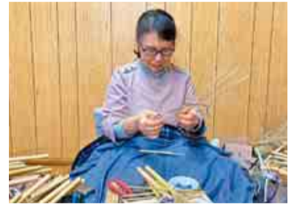
うちの太田屋(伝統工芸・南房総市)