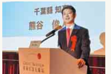
千葉県企業誘致セミナー in 台湾 (11月15日)

県内各地域に雇用を創出し、働き盛りや子育て世代が千葉県で住み、働き続けられるよう、経済産業政策の充実に取り組んでいます。