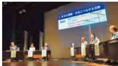
国際理解セミナー

また、1月下旬には千葉県で暮らす外国出身の方々にもご参加いただき、多文化共生について学ぶ「国際理解セミナー」も予定しています。