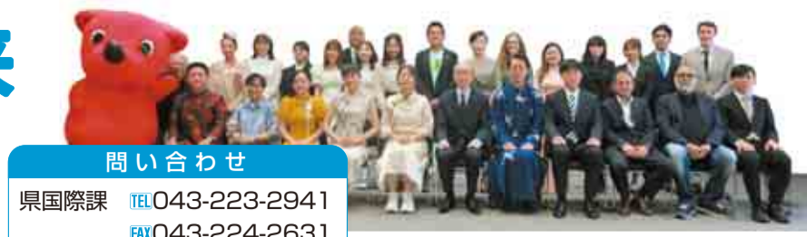
チーバくんグローバルパートナーズの皆さん