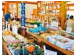
特産品が並びます

片倉ダムのダム湖である笹川湖に囲まれ、まるで湖に浮かぶような道の駅。週末になると、新鮮な地元野菜などの農産物や、君津の名水で造られた地酒などを買いたい人々にぎわいます。中でも特産の産みたて卵は種類も多く、人気があります。