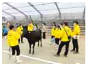
出品前日の最終確認