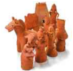
古代人の表現力にびっくり

芝山町周辺では、6~7世紀ごろにかけて古墳が盛んに造られました。殿塚・姫塚古墳などから数多くの埴輪が出土したことから「はにわの町」として知られています。当博物館は昨年4月にリニューアルオープンし、常設展示が一層充実。武人・馬子・巫女などの人物をはじめ、家・鳥・馬・魚など、表情豊かで造形美にあふれた埴輪の数々は必見です。