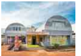
入り口では埴輪のレプリカがお出迎え

芝生広場やミニアスレチックのある芝山公園や、芝山仁王尊も隣接しているので、子どもから大人まで楽しめます。