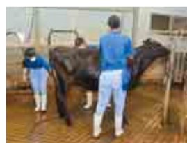
牛のお世話も協力して行います

安房拓心高校の畜産部では、朝7時から餌やりや牛舎の清掃を行うなど牛と真摯に向き合っています。