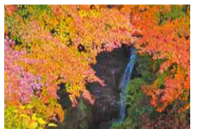
地蔵堂の滝と紅葉

志駒川に沿って走る県道182号上畑湊線に、約10kmにわたって続く「もみじロード」。晩秋には約1,000本のもみじが鮮やかに色づきます。切手にもなった船戸橋周辺の紅葉や地蔵堂の滝にかかるもみじなど、名所が点在しているので、車を止めてゆっくり散策するのがおすすめ。また、「志駒不動様の霊水」と呼ばれる天然水の水汲み場もあり、立ち寄りスポットとして人気です。