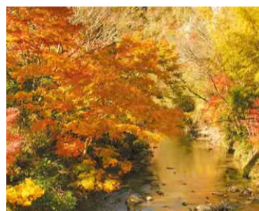
船戸橋周辺の「切手のもみじ」

志駒川に沿って走る県道182号上畑湊線に、約10kmにわたって続く「もみじロード」。晩秋には約1,000本のもみじが鮮やかに色づきます。切手にもなった船戸橋周辺の紅葉や地蔵堂の滝にかかるもみじなど、名所が点在しているので、車を止めてゆっくり散策するのがおすすめ。また、「志駒不動様の霊水」と呼ばれる天然水の水汲み場もあり、立ち寄りスポットとして人気です。