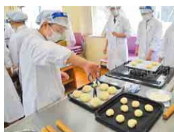
パン作りの基礎から学びます(製パン実習の様子)

八千代高校では、家政科の生徒と、八千代市や八千代商工会議所、市内のパン屋との連携の下、オリジナルのパンを開発・販売する「やちパンプロジェクト」を行っており、今年で5年目を迎えます。これまで、地元の食材を使って、高校のイメージカラーを表現したパンや、八千代市のキャラクター「やっち」をデザインしたパンなど、さまざまなオリジナルのパンが商品化されました。