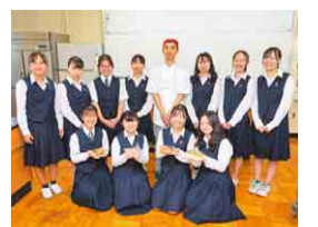
私たちが考えたパンをどうぞ!

今後、さらに改良を重ね、今月下旬から12月上旬に、プロジェクトに協力している、八千代市内のパン屋やスーパーなどで販売される予定です。