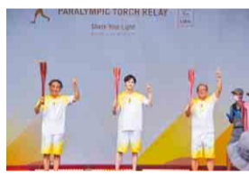
アイムポッシブル

県内の聖火リレーイベントに出演予定だった団体によるプログラムの披露や、オリンピック・パラリンピック出場選手の出演とインタビュー、千葉交響楽団による東京2020オリンピック・パラリンピックにちなんだ楽曲のコンサートを開催します。また、聖火リレートーチやI'mPOSSIBLEアワード受賞校の取り組みの展示なども実施します。