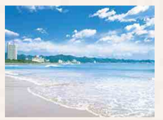
前原横濱海岸(鴨川市)