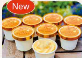
房州びわと千葉県産牛乳を使用したびわソフトクリーム(8個入り)