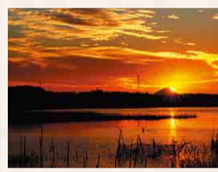
手賀沼ダイヤモンド富士(柏市)