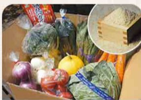
食育ソムリエが選ぶ旬の野菜ボックス & 千葉のお米(5kg)