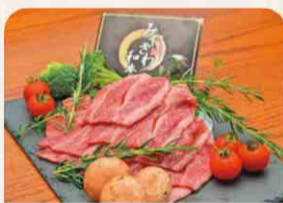
チバザビーフ (みやざわ和牛)