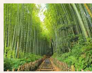
サムライの古径ひよどり坂(佐倉市)