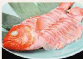
銚子つりきんめのしゃぶしゃぶ