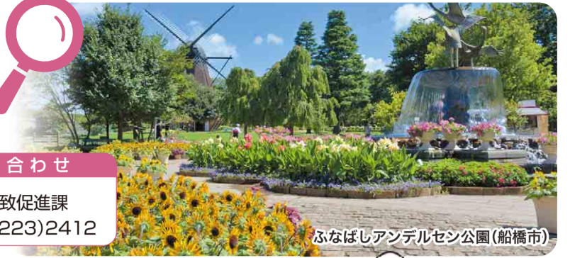
ふなばしアンデルセン公園(船橋市)