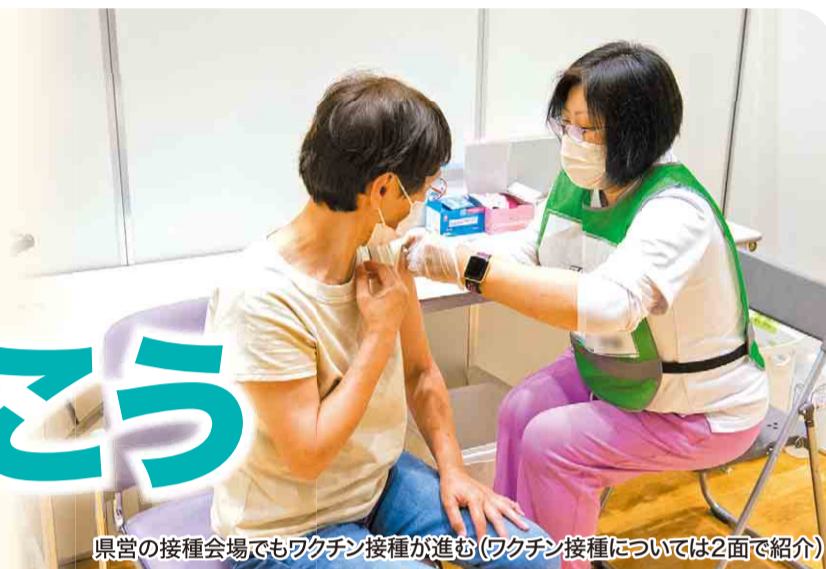
県営の接種会場でもワクチン接種が進む(ワクチン接種については2面で紹介)