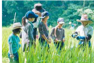
令和2年度大賞受賞団体の活動の様子