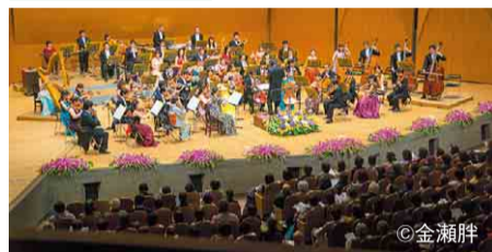
千葉交響楽団と新年を祝おう!