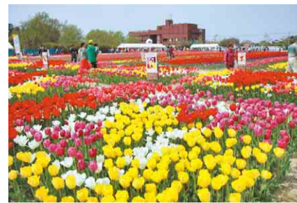
一面に広がるチューリップ畑を散策

イベント日には、中学・高校生によるパフォーマンス、農産物や花の販売、野だてなどを開催!色とりどりの花とともにお楽しみください。