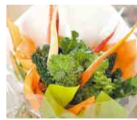
「野菜が甘い」と驚かれます