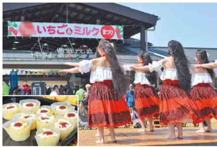
いちごのカップケーキ(左) フラダンスの披露にも注目(右)

また、YOSAKOIやキッズダンスの披露、いちごジャム・バター作り(有料)、模擬搾乳体験などが楽しめるほか、ニッポン全国鍋グランプリ2017年で優勝し殿堂入りを果たした源右衛門鍋のとん汁も登場します。