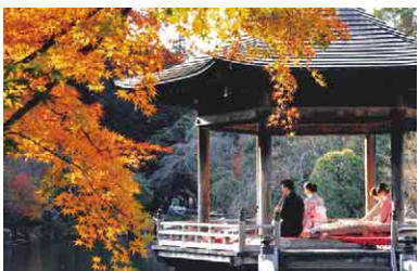
風情ある音色にゆっくり耳を傾けて

成田山新勝寺大本堂の奥に広がる成田山公園では、モミジ、クヌギ、ナラ、イチョウなど、約250本の木々が鮮やかに色づきます。散策路に折り重なる紅葉、池の水面に赤や黄色の葉が映り込む様子など、日本庭園ならではの美しい景色が広がり、足を進めるたびに違った表情を楽しめます。