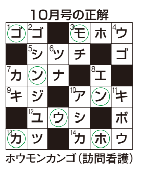
ホウモンカンゴ(訪問看護)