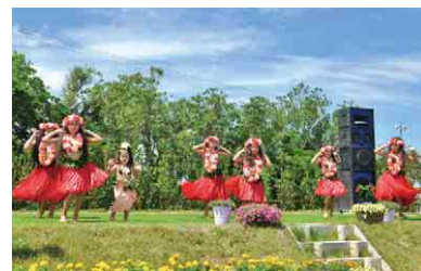
子どものフラダンスもかわいい

地元のこだわりグルメや雑貨が勢ぞろい!農家自慢の新鮮野菜を使った総菜パンやカレー、自家製フルーツたっぷりのスイーツに加え、貝殻や流木を使った手作り雑貨など、人気店が並びます。