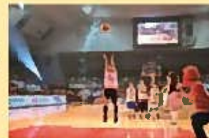
CHIBAJETS FUNABASHI