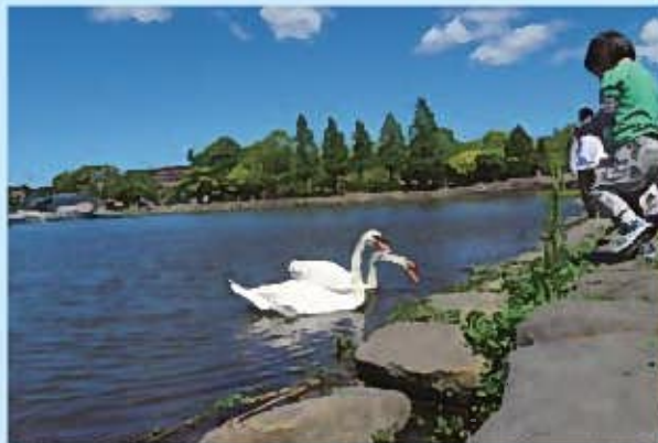
水鳥と出会える手賀沼公園

我孫子駅南口東公園 → 杉村楚人冠記念館 → 白樺派の小径 → 志賀直哉邸跡 → 旧村川別荘 → 子の神大黒天 → 手賀沼公園 → 天神坂 → 嘉納治五郎別荘跡 → 我孫子駅南口東公園