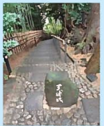
かの文人たちも歩いた「天神坂」