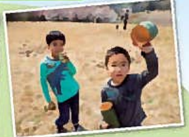
のこぎりを使って竹切り体験