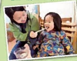
石窯で焼く、ピザ作り