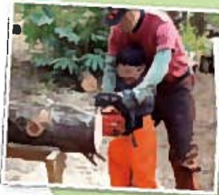
チェーンソー体験