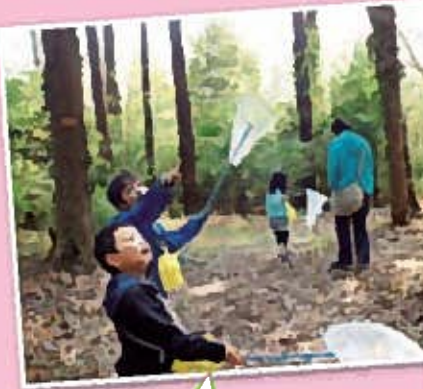
まつりを通して友達もGET!!一緒に炭焼きの森・森の小道を探索!!