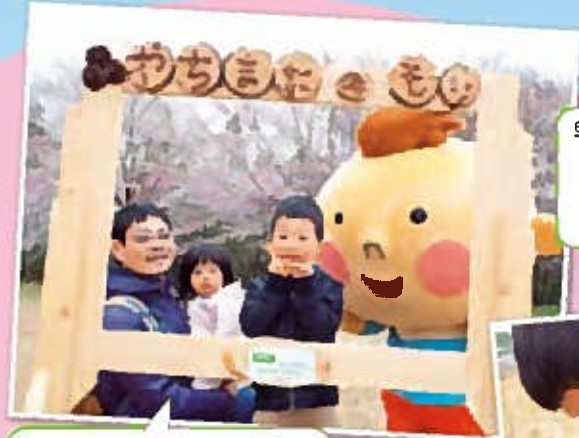
生きものが大好きな男の子。森を探索してみよう!

当日は約400人の方々が来場し、森の自然を思う存分体感しました。どんな風に八街の森まつりを楽しんだのか覗いてみましょう。