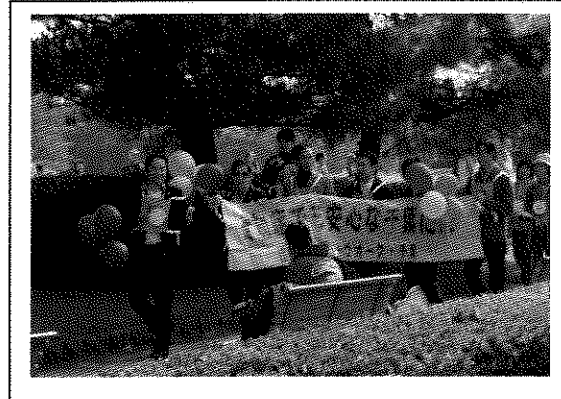
昨年のメモリーウォークの様子

歩くことは認知症の予防につながります。今年は青葉の森公園でクイズをしながら楽しく歩き、認知症についての理解を呼びかけます。