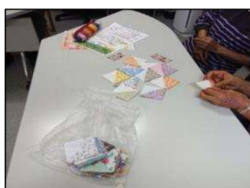
「アルツハイマー月間に大型ショッピングセンターでの認知症啓発イベントで配布するシオリをみんなで作成