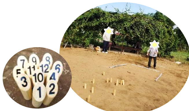
栗カフェ・ガーデン 「モルックをみんなで！」