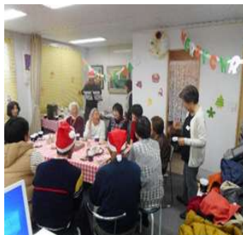
認知症カフェ開催時の様子