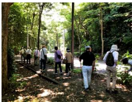
オレンジ散歩の様子

オレンジ散歩の会場まで行けない方に対し、近隣のオレンジフレンドが出張し、認知症の人が地域の方と一緒に散歩する機会を作る。