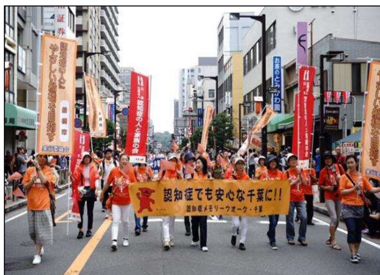
メモリーウォークの様子 (令和元年7月28日)