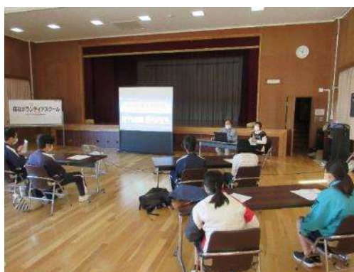
認知症サポーター養成講座の様子↓

写真は第3回の様子で、前半は介護の現場経験も豊富なキャラバンメイトの皆さんによる、認知症サポーター養成講座を行い、参加した生徒の皆さんに認知症サポーター証を配布した。後半は車いすに実際に乗ったり、動かしたりしながら障害について考え、学びを深めた。