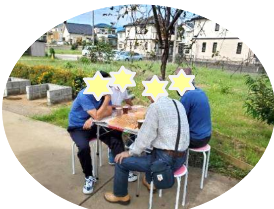
栗カフェ・ガーデン

栗カフェ・ガーデン、パトウォーク、出張包括、個別支援、その他包括主催の事業の数々に、毎年アンケートをとり参加している。