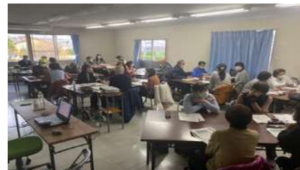
フォローアップ研修の様子