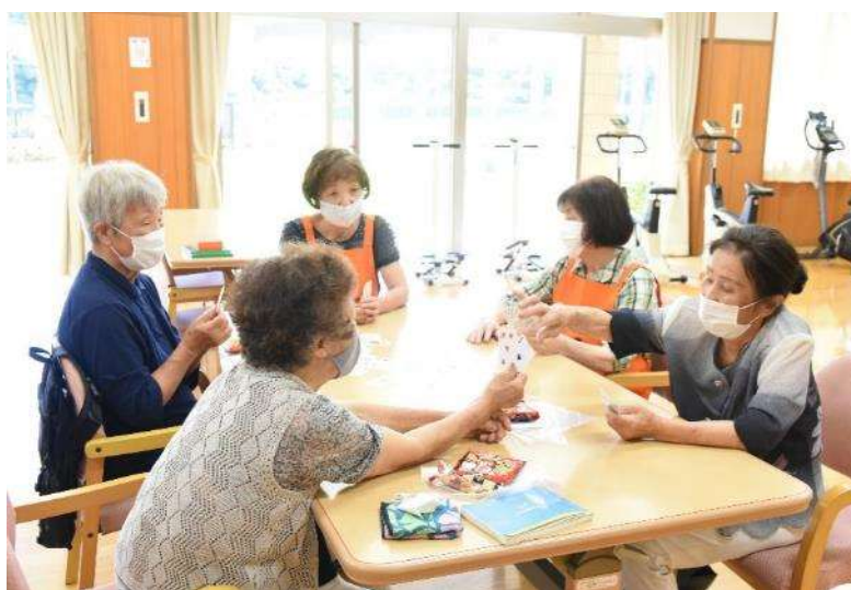
ボランティアと参加者がトランプをしている様子