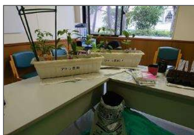
「花を育てたい」「野菜を育てたい」を実現！！

○現在は新型コロナウイルス感染拡大防止のため、入場制限をしていますが、色々な方と繋がるためオンライン(Zoom)も活用しています。