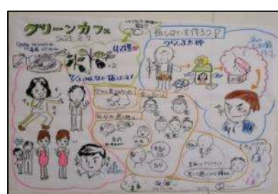
認知症サポーターステップアップ講座修了者がカフェ参加者の発言や活動内容をイラストで記録