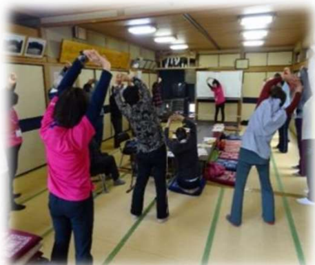
【各介護予防教室の様子】