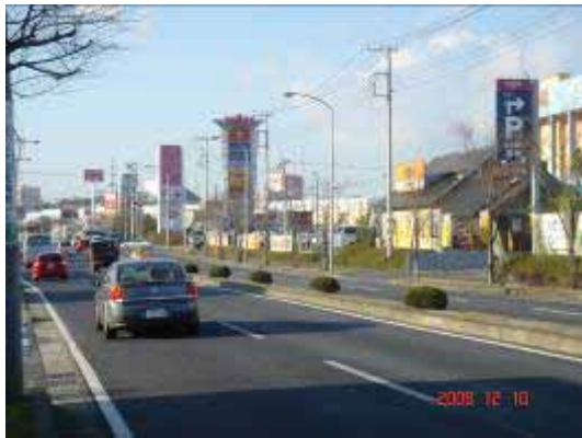
既成市街地（土屋地区）