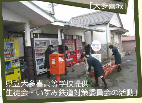
「生徒会・いすみ鉄道対策委員会の活動」