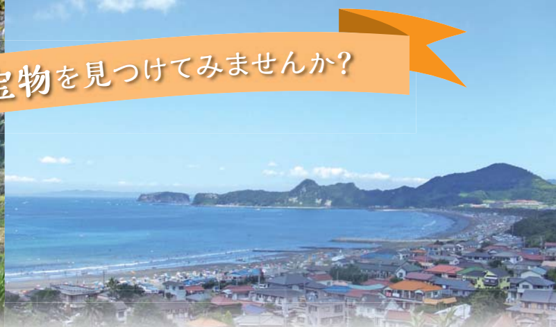
たかさき いわい 「高崎公園から望む岩井海岸」