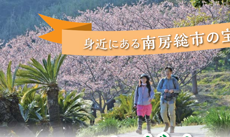
ほうこえん 「抱湖園」