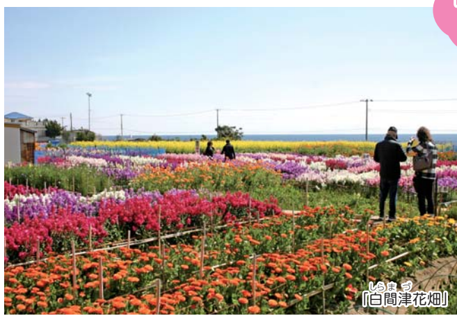
いばらき 「白間津花畑」