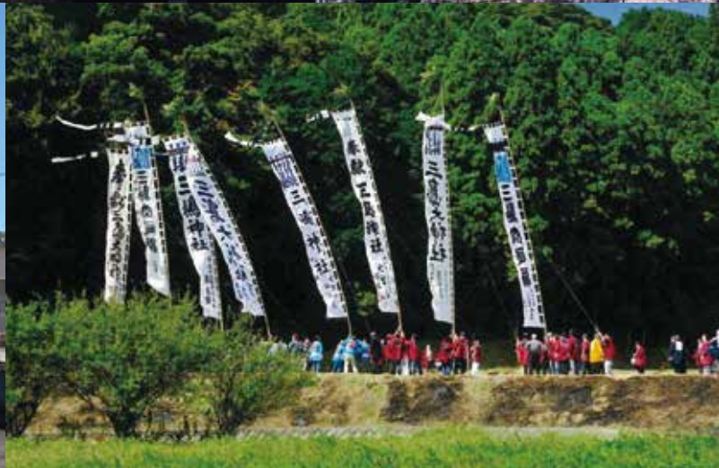
久留里線プロジェクト 高校生フォトコンテスト入賞作品