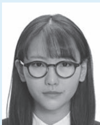
眼鏡のフレームが目にかかっているもの