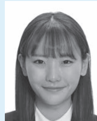
口角が上がる等により実際の容姿と著しく異なるもの