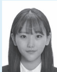
変形やマスク等の画像処理を施したもの