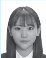
目を大きくしたり、顔のパーツが変形したもの