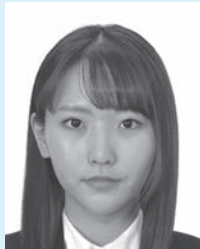
顔の輪郭が隠れるもの