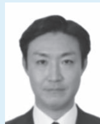
ピンぼけや手ぶれにより不鮮明なもの