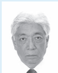
頭、髪、服装等と背景の境界が不明瞭なもの