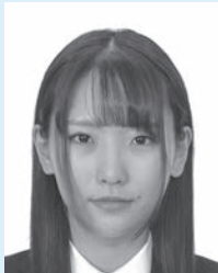
髪が目にかかっているもの