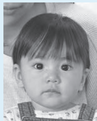
補助者の体の一部が写り込んでいるもの