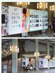
※写真は2020年のものです。

ちばアート祭は、あらゆる方が参加・体験できる、千葉県主催の文化プログラムです。ちばの多彩な文化的魅力を存分に感じ楽しんでもらえるよう、千葉の文化的魅力を集めた「次世代に残したいと思う『ちば文化資産』」を会場や作品テーマに開催します。