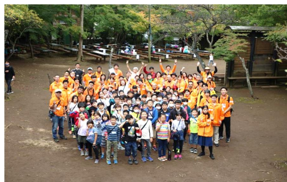
みんなで記念写真☆