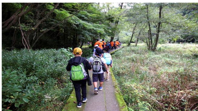
自然豊かな大町公園を散策

今年は「やっちゃんよ！子ども村」をテーマに、班活動中心のプログラムを行いました。「みんな de ゲーム」では班の仲間をつなげるアイスブレイクを、「Oh! machi クエスト」では、大町公園の中に散りばめられたミッションを班ごとにクリアしていきました。昼食や午後のアスレチックではすっかり仲良くなっていた子どもたちが、笑顔いっぱいの時間を過ごしました。