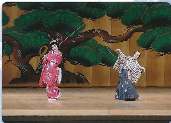
千葉県文化会館（こども歌舞伎）