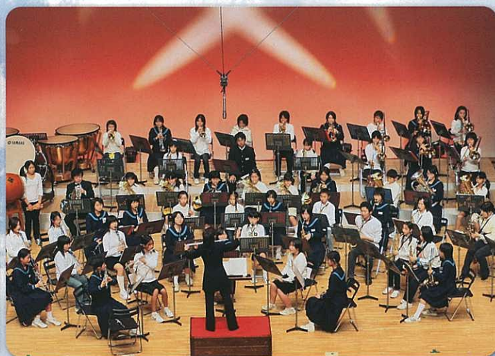
千葉県東総文化会館（TOSOプラスバンドフェスティバル）