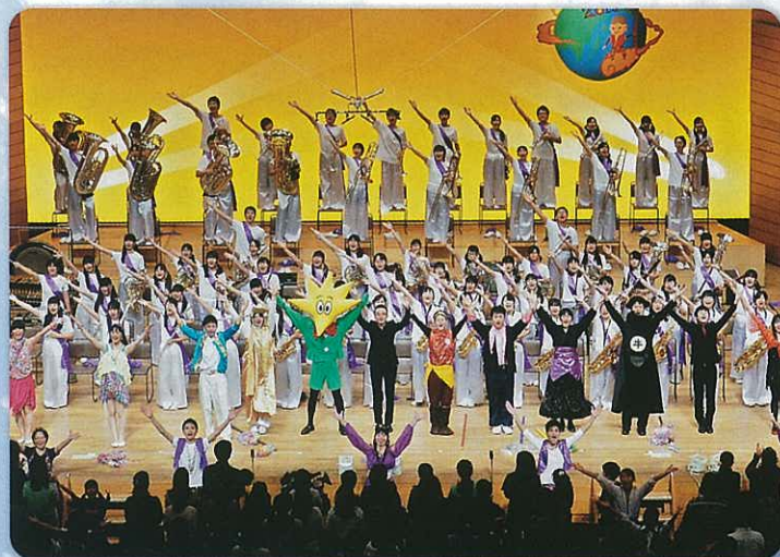
千葉県南総文化ホール（南総フェスティバル）