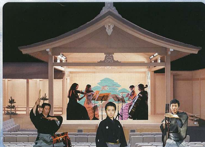
青葉の森公園芸術文化ホール（能楽四重奏）