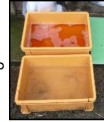
推奨される踏込消毒槽の設置方法