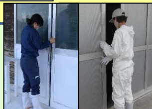
出入りの最小限化