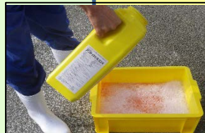
家きん舎毎の消毒