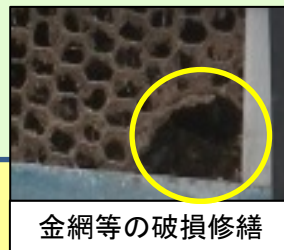
金網等の破損修繕