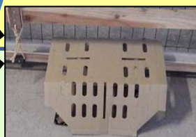
ねずみ対策 (トラップ設置)