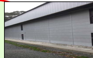
家きん舎周辺の整理・整頓