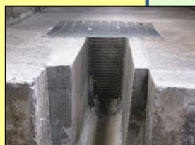
排水溝等からの侵入防止対策 (鉄格子の設置)