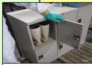
家きん舎専用の靴使用