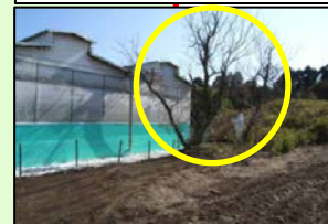
家きん舎周囲の樹木の剪定