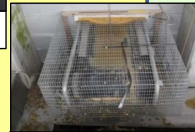
集卵・除糞ベルトの開口部の隙間対策