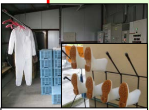
専用の服や靴の使用