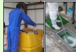
消毒液の定期的交換