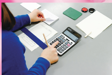
職域開拓コース 10名 (1年)