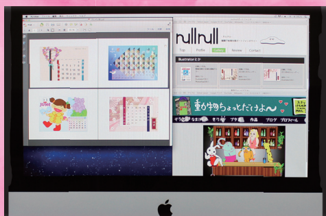
DTP・Web デザインコース 10名 (1年)