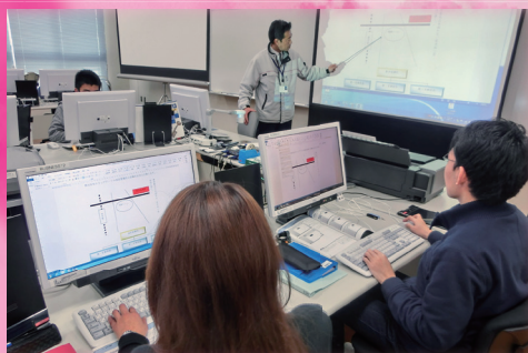
PC ビジネスコース 20名 (1年)