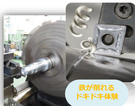
鉄が削れる ドキドキ体験