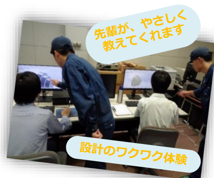
先輩が、やさしく 教えてくれます