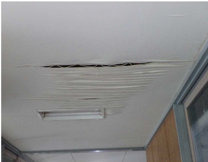
雨漏りによる天井の剥がれ