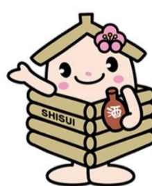
井戸っこ (しすいちゃん)