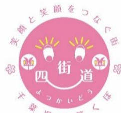
笑顔と笑顔 をつなぐ街