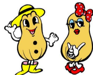
ピーちゃん ナツちゃん