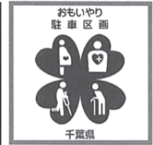
図② おもいやり駐車区画