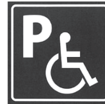
図① 車いす使用者優先駐車区画