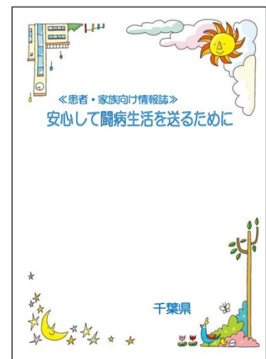
図4-3-10: 患者向け情報誌「安心して闘病生活を送るために」