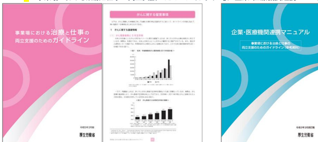
図表4-3-5:「事業場における治療と仕事の両立支援のためのガイドライン」、「企業・医療機関連携マニュアル」

また、拠点病院等のがん相談支援センターでは、がんを抱える従業員の働き方に関する事業者・企業の人事労務担当者からの相談や、事業者・企業と担当医との間の調整も行っています。