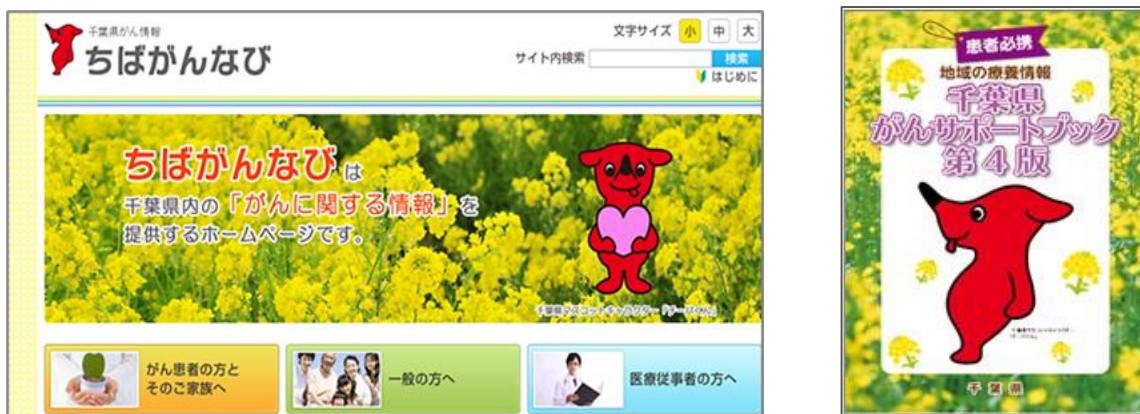
図表4-3-2: 「千葉県がん情報 ちばがんナビ」と「地域の療養情報 千葉県がんサポートブック」

しかし、令和5年7月に県が一般県民を対象に実施した「医療に関する県民意識調査」では、ちばがんナビを「知らない」と答えた割合は89.9%、「知っているが利用したことはない」は8.3%、「知っており利用している」は1.8%でした。